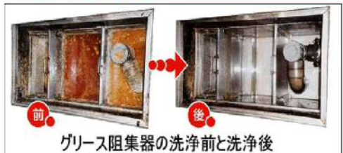
グリース阻集器の洗浄前と洗浄後