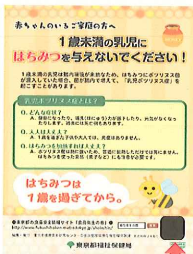
A 5判リーフレット（平成30年版、令和元年版）